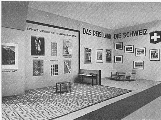
Die SBB an der Reklameschau Berlin Les CFF à l'Exposition internationale de publicité à Berlin