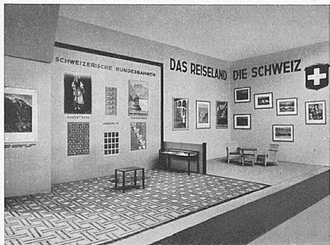
Die SBB an der Reklameschau Berlin Les CFF à l'Exposition internationale de publicité à Berlin