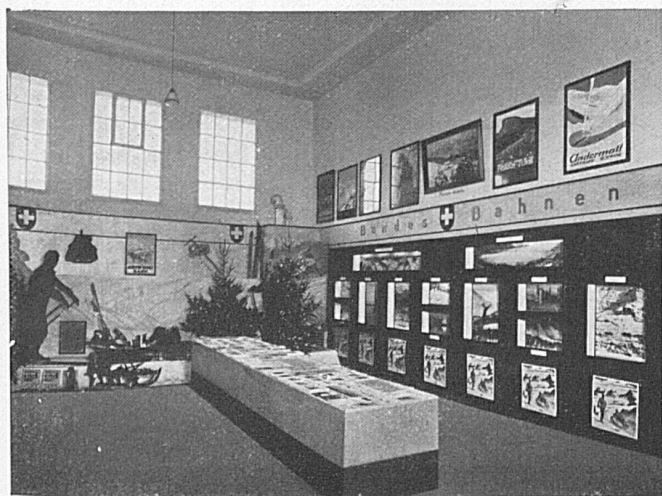
Der Stand der SBB an der Leipziger Herbstmesse Le stand des CFF à la Foire d'automne de Leipzig

Die schweizerischen Bundesbahnen, für die Deutschland als touristisches Einzugsgebiet von eminenter Bedeutung ist und die vor Jahresfrist in Berlin ein völlig neu eingerichtetes Reisebureau eröffnet haben, treten auch an deutschen Ausstellungen und Messen werbend auf.