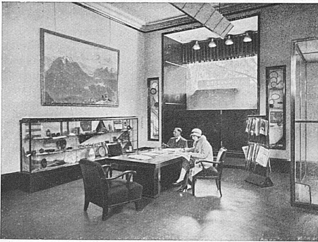
Innes der neuen SBB-Agentur Berlin Intérieur de la nouvelle agence CFF à Berlin