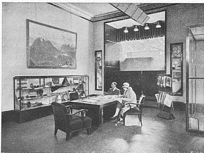
Innere der neuen SBB-Agentur Berlin Intérieur de la nouvelle agence CFF à Berlin