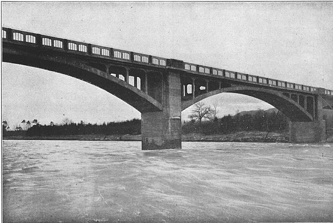
Strassenbrücke über die Thur bei Weinfeldern

Kaiser & Cie Centralbahnplatz 6, Hotel Continental, Telephon Safran 47.60. Basel