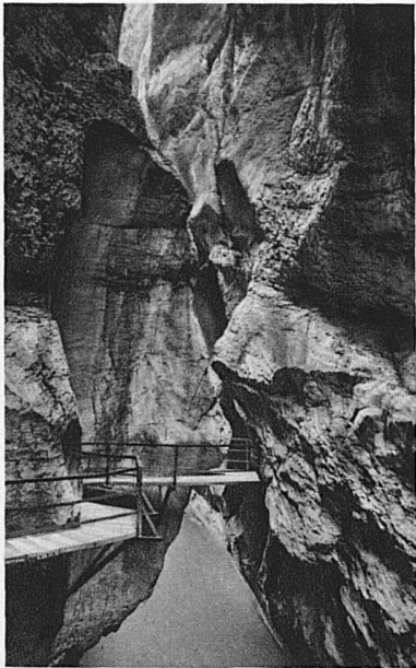
Links: Aareschlucht bei Meiringen / A gauche: Les Gorges de l'Aar, près Meiringen / On the left: Aar-river near Meiringen / A sinistra: Le gole dell'Aare presso Meiringen