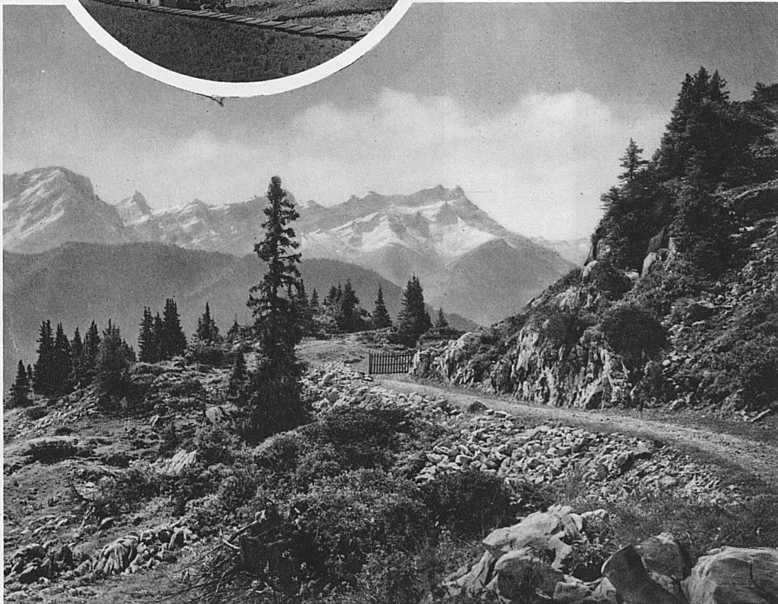
Ausblick von Leysin / Site alpestre au-dessus de Leysin / View from Leysin / Angolo romantico sopra Leysin