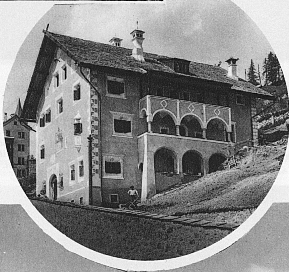
Das Segantini-Museum in St. Moritz / Le Musée Segantini à St-Moritz / The Segantini Museum in St. Moritz / Il museo Segantini a St. Moritz