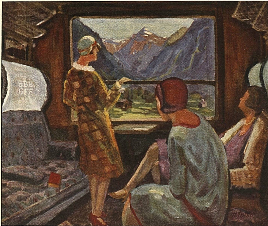
Moderner Eisenbahnkomfort Im I. Klass-Abteil der Bundesbahnen Confort moderne en voyage Coupe de 1 re classe des chemins de fer fédéraux