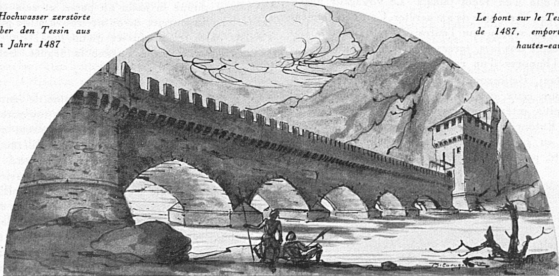
Le pont sur le Tessin, datant de 1487, emporté par les hautes-eaux

Und noch einen Vorteil werden die Schützen den Frühjahrs- und Herbsttouristen voraushaben: dass sie mit dem Tessiner Volk in nähere Berührung kommen werden. Von Landvögten wurde einst gesagt, sie seien nach Ablauf ihrer Amtszeit und Rückkehr in die nordische Heimat durch «nüwe kuriose Anmutigkeit» aufgefallen. Das dankten sie dem Verkehr mit diesem Volke, das Kindern als erstes die gentilezza, die Liebenswürdigkeit beibringt, die man hier auch an den einfachsten Menschen bewundern muss. Und die Miteidgenossen werden an den Tessinern eine durch keinerlei neumodische Hast verdorbene Gemütlichkeit schätzen lernen. Beides Eigenschaften, die schon Goethe beim Bereisen des Südhangs der Alpen auffielen: «Geselligkeit und Gefälligkeit, eine freie Art Humanität, die aus einem immer öffentlichen Leben hervorkommt.»