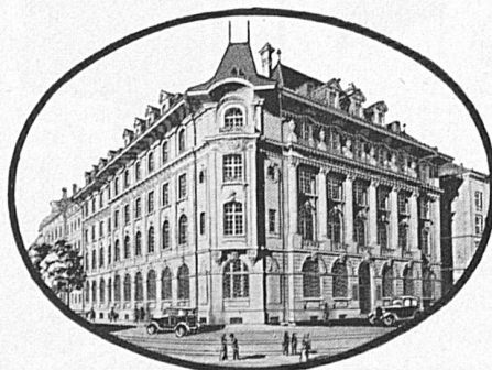
Sitz der Zentralverwaltung in Bern

Amriswil Basel Bern Biel Brugg Delémont Fribourg Genève Glarus Kreuzlingen Lausanne Locarno Luzern Montreux