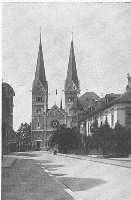
Die St. Martinskirche