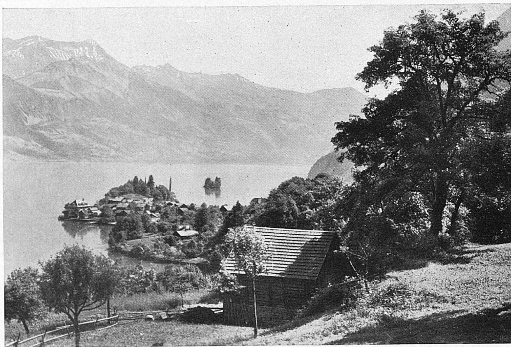
Iseltwald am Brienzersee / Iseltwald sur le lac de Brienz