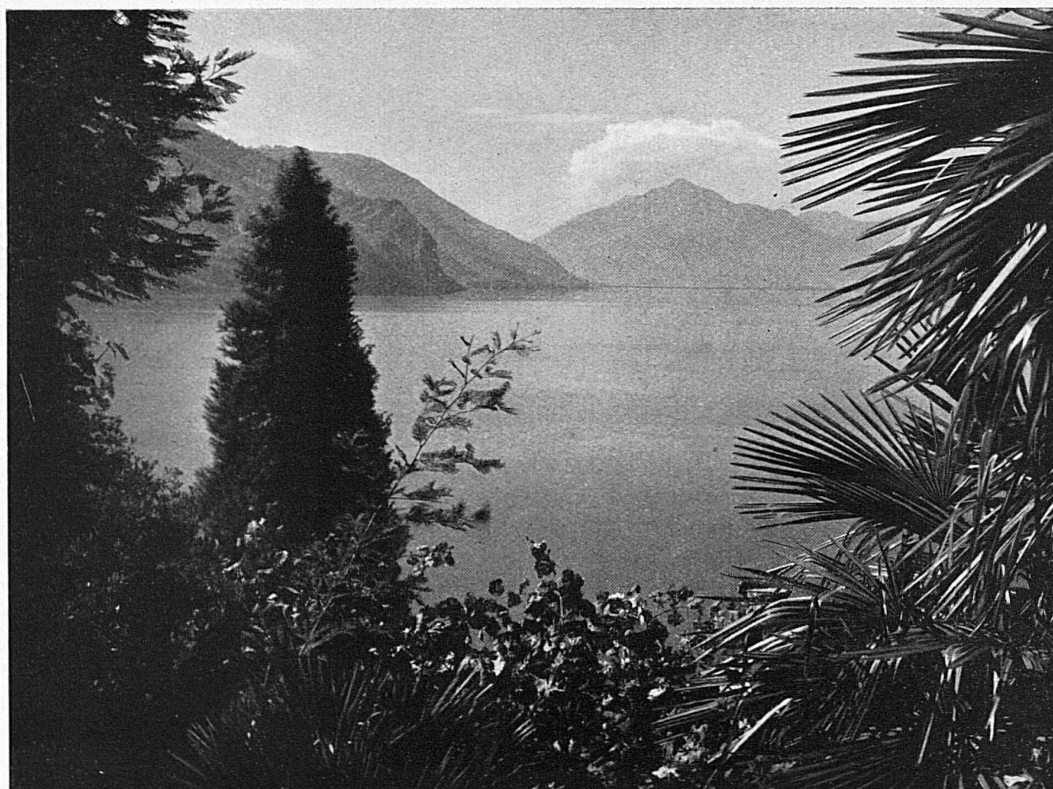
Ravissante échappée sur le lac de Lugano / Entzückender Ausblick auf den Luganersee