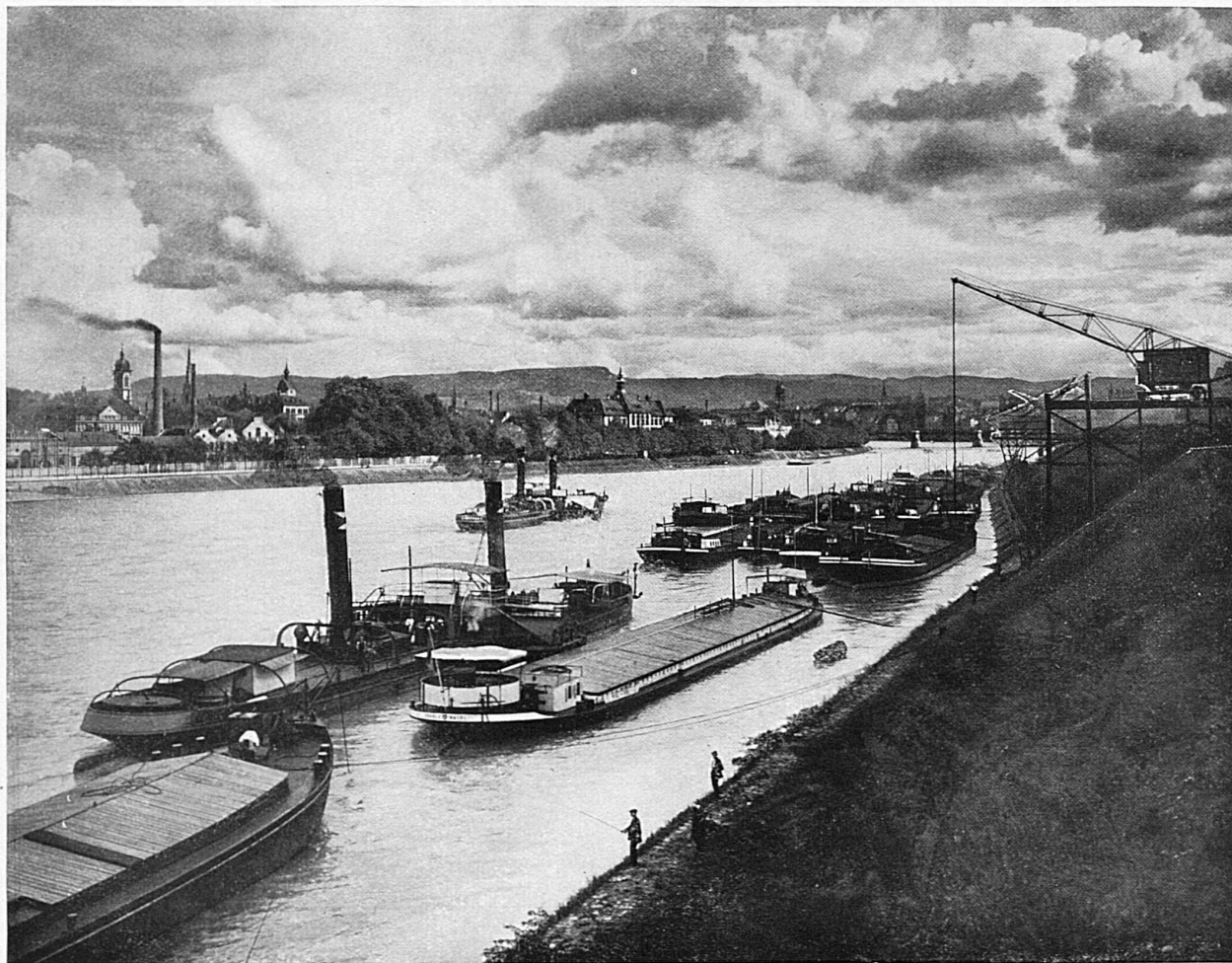
Le port ouvert des CFF à Bâle-St. Jean / Der offene S B B-Rheinhafen St. Johann in Basel