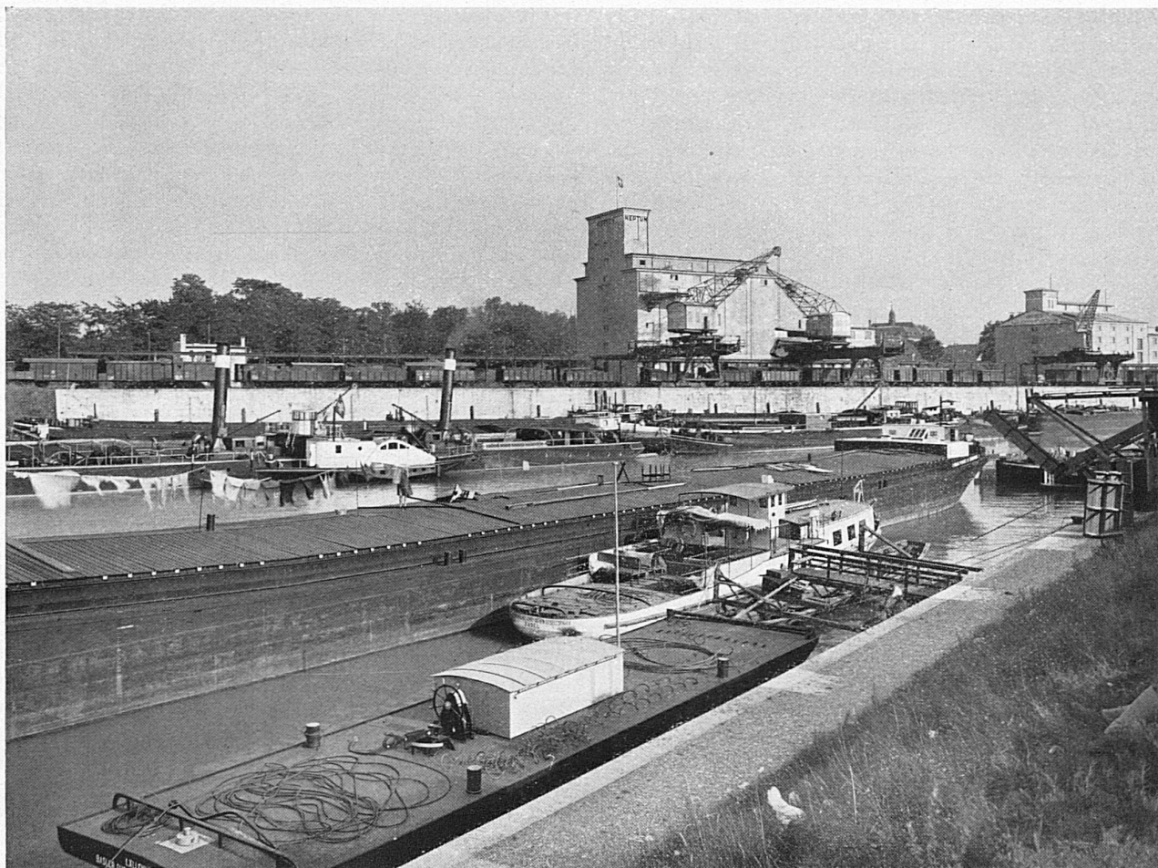
Le port du Rhin à Kleinhüningen et les silos à grains de la Société suisse de remorquage Der Rheinhafen Kleinhüningen mit dem Getreidespeicher der Schweizer Schleppschiffahrtsgenossenschaft