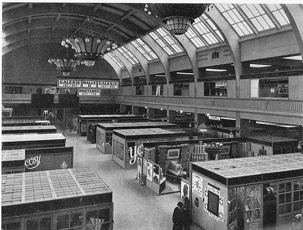
Intérieur d'une halle d'exposition / Inneres einer Ausstellungshalle