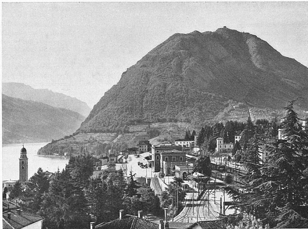
Bahnhof Lugano mit Monte S. Salvatore ~ / La gare de Lugano et le Monte S. Salvatore