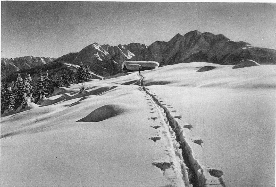
Auf den Flimser Höhen / Sur les hauteurs de Flims / On the Heights above Flims / Sulle alture di Flims