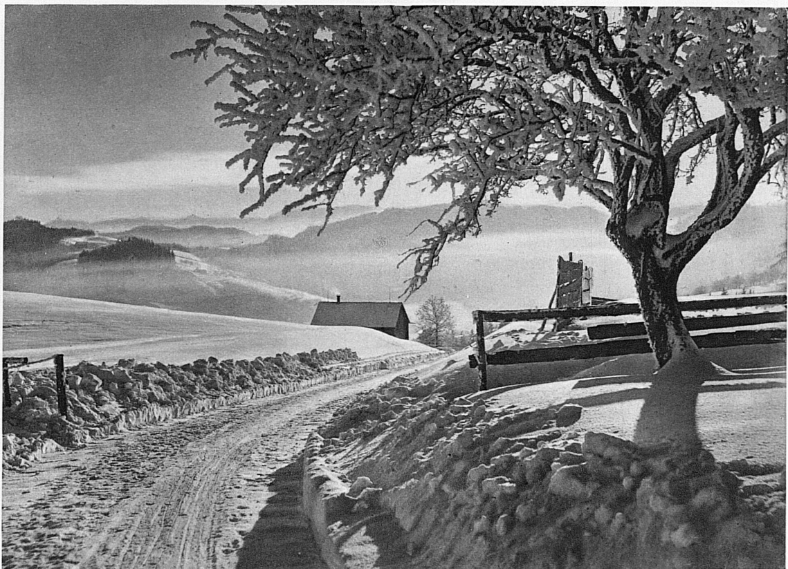
Rauhreifstimmung im Umkreis von Heiden / Effet de givre à Heiden / Hoar-frost at Heiden / Brinata ad Heiden