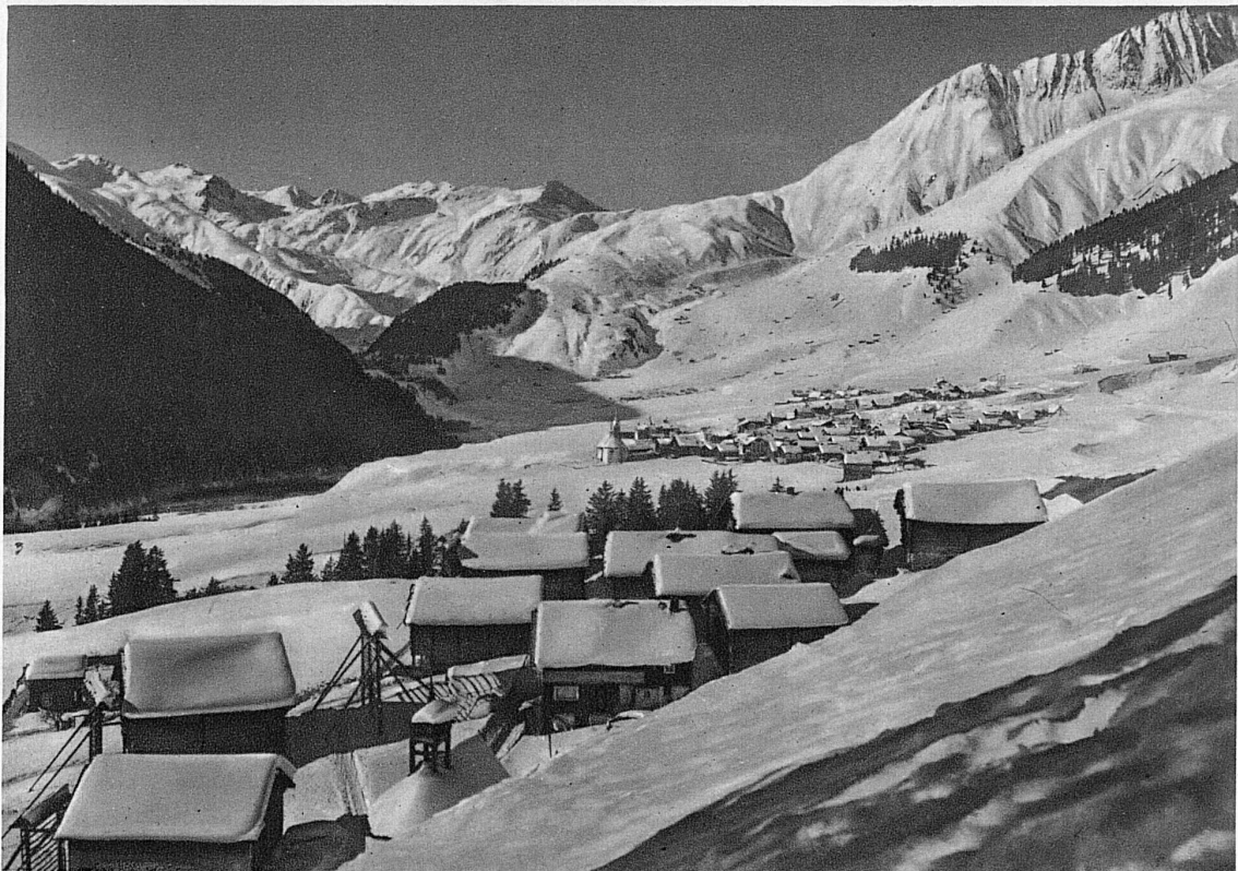
Sedrun im Thal des jungen Rheins / Sedrun, dans la haute vallée du Rhin / Sedrun, near The Sources of the Rhine Sedrun alla sorgente del Reno