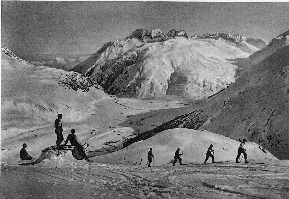
Hospenthal und Andermatt im Herzen des Gotthardmassivs / Hospenthal et Andermatt, au coeur du massif du St-Gotthard Hospenthal and Andermatt in the heart of the St. Gotthard massif / Hospenthal ed Andermatt, nel cuore del massiccio del Gottardo