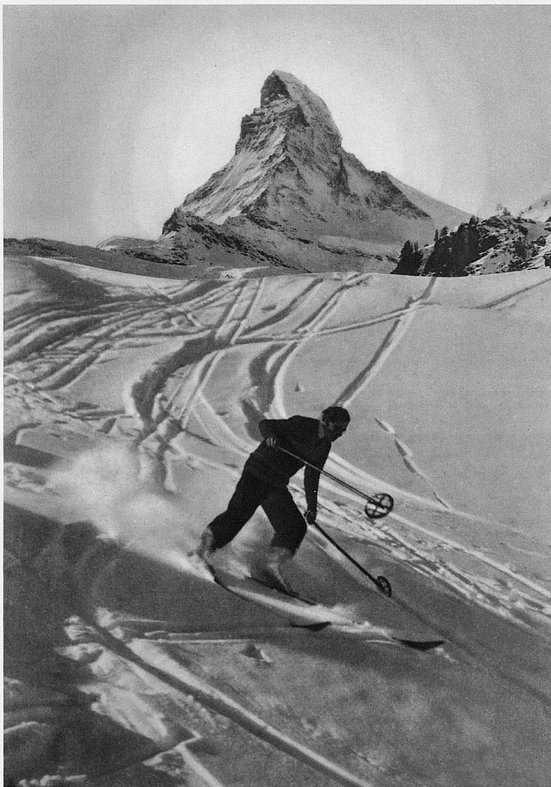
Am Fusse des Titanen / Au pied du géant / At the foot of the Giant / Ai piedi del Titano Zermatt, der neueste Winterkurort / Zermatt, la nouvelle station hivernale / The latest Winter Sport Centre, Zermatt Zermatt, la nuovissima stazione invernale