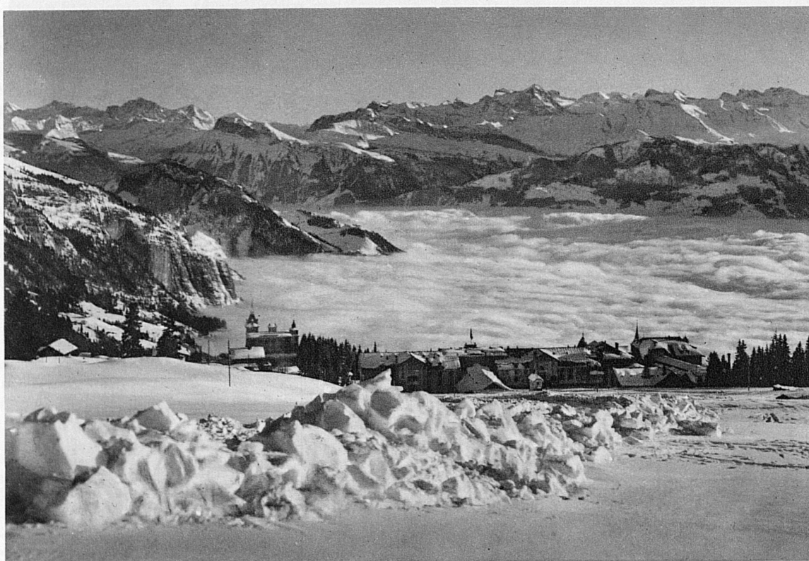
Der Rigi in blendender Wintersonne über dem Nebelmeer / Le Rigi, inondé de soleil, au-dessus de la mer de brouillard Sunshine on the Rigi, above a Sea of mist / Righi in pieno sole invernale sopra il mare di nebbia