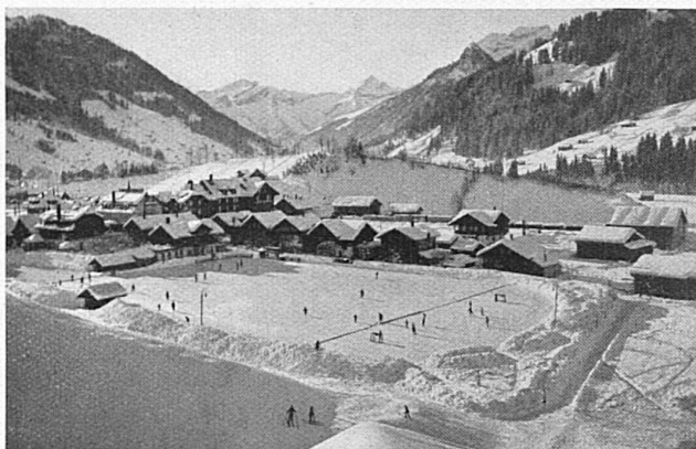
Ein prächtiges Eisfeld in Gstaad Magnifique patinoire à Gstaad