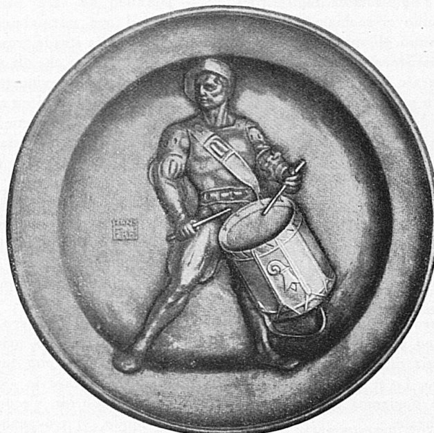
Basler Trommler. Zinnteller-Sujet von Hans Frey, Medailleur, Basel Tambour bâlois. Plat d'étain, œuvre du médailleur H. Frey, Bâle

ment un homme en vue et fortuné, il change chaque année) qui fait des largesses au peuple; ils multiplient les bals masqués, où seules les femmes portent costume et masque. Plus attachés à leur fête traditionnelle du Sechseläuten, qu'au carnaval proprement dit, les Zurichois s'efforcent de rivaliser, à leur manière, avec Bâle et Lucerne. Leur Fastnachtsgesellschaft cherche à relever le ton de ces manifestations en stimulant le goût et l'esprit d'invention pour les costumes et le choix des sujets, sans oublier les devoirs envers la bienfaisance. C'est là, du reste, une tendance qui se manifeste dans d'autres villes suisses également, où le