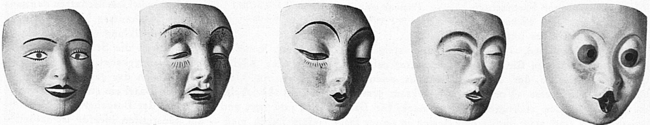
Baslerische Larvenmodelle von Bildhauer Max Varin / Modèles de masques bâlois, par Max Varin, sculpteur

Fast so berühmt wie das Trommeln sind die Basler Maskenbälle . In allen grösseren Lokalitäten werden sie am Montag und Mittwoch von 8 Uhr abends bis 4 Uhr morgens abgehalten. Die vornehmsten Bälle finden im Stadtkasino statt, veranstaltet vom Verein Quodlibet (am Montag) und von der Basler Casinogesellschaft (am Mittwoch), und man darf wohl sagen, dass «tout Bäle» daran teilnimmt. Ob sich der Ballbesucher nun unter den Tanzlustigen und Tanzfreudigen befindet, oder ob er von hohem Balkon herab sich das bunte Treiben ansieht, er wird auf seine Rechnung kommen und sich an dem ungemein farbenfrohen Bilde erfreuen. Künstlerhände haben die Dekorationen besorgt, Künstlerhände wiederum haben die apartesten und elegantesten Kostüme entworfen, und es steht der Jury eine schwere Aufgabe bevor, unter den Hunderten von originellen Einfällen die richtigen auszuzeichnen und zu prämiieren. In eifrigen Wettbewerb mit den Kasinobällen treten die Maskenbälle der Mustermesse, deren prächtige Räumlichkeiten