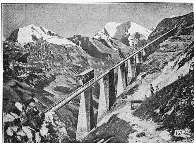
SEILBAHN NIESEN, Berner Oberland. Totale Länge 3496 m überwindene Höhe 1645 m, Maximalsteigung 68%.

Walzwerke, Schmiede, Gießereien, Elektrostahlwerk, mech. Werkstätten