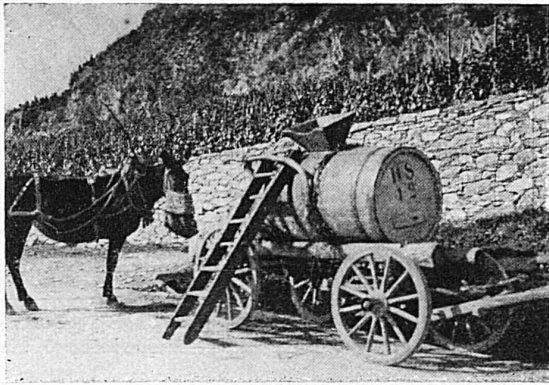
Côteaux du Rhône

chantement des petits enfants qui lisent dans ses étincelles les plus beaux contes de fées, et quoi de meilleur pour réussir la gaufre dans le vieux fer forgé et ciselé aux armoiries de la famille?