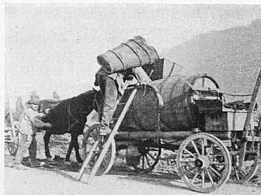
Rentrée de la vendange

Le soir, au pressoir, on danse aux sons d'un accordéon ou d'un violon tenu par un artiste du cru. Le dimanche, dans les auberges, une fanfare fait tourner les couples et joue sur les places publiques. Le moût fauve bouillonne dans les verres; les marrons chantent dans la rôtissoire — c'est ce qu'on appelle en terre romande les « châtaignes brizolées ». Des mascarades s'or-