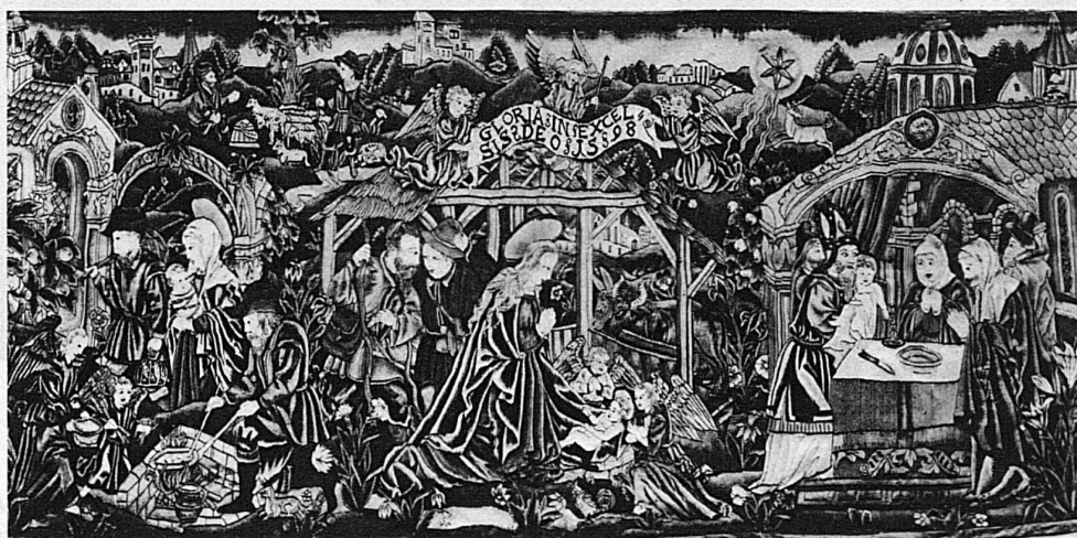
Antependium aus dem Kloster St. Anna im Bruch bei Luzern, 1598 / Antependium du couvent de Ste-Anne aux environs de Lucerne, 1598 Antependium del monastero di St. Anna a Bruch presso Lucerna, 1598