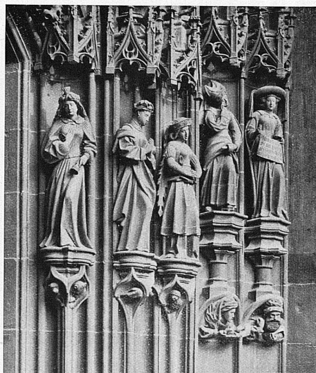
Die weisen und die törichtten Jungfrauen am Münsterportal in Bern / Les vierges sages et les vierges folles, à l'entrée de la cathédrale de Berne