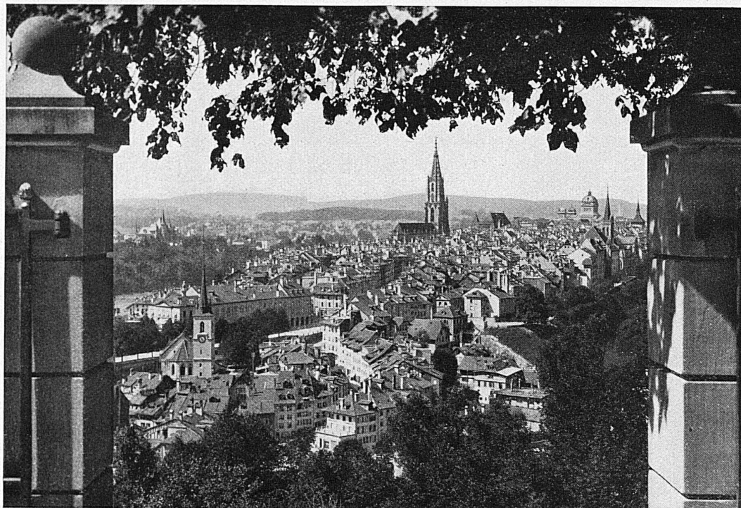
Ausblick vom Rosengarten auf die Altstadt / Coup d'œil du jardin des roses sur la vieille ville