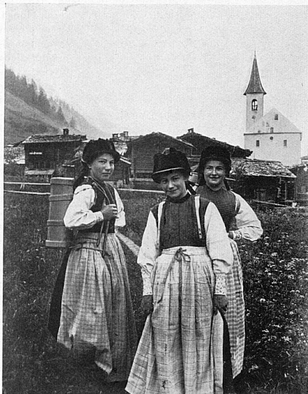
Im Lötschental / Dans la vallée de Latschen

Un tel effort, de si louables sacrifices, méritent certes la reconnaissance des autorités et du public, et il faut espérer que les foules accourront de tout le canton et