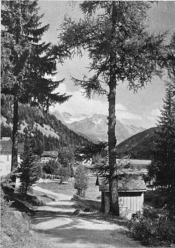
Lac de Champex et le Grand Combin