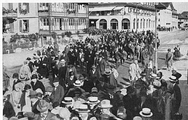
Extrazugsverkehr / La foule quitte un train spécial

Aenderungen bleiben vorbehalten. Näheres wird durch Plakate und Zeitungsinserate bekannt gegeben.