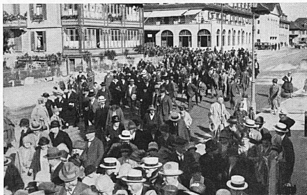
Extrazugsverkehr / La foule quitte un train spécial

Änderungen bleiben vorbehalten. Näheres wird durch Plakate und Zeitungsinserate bekannt gegeben.