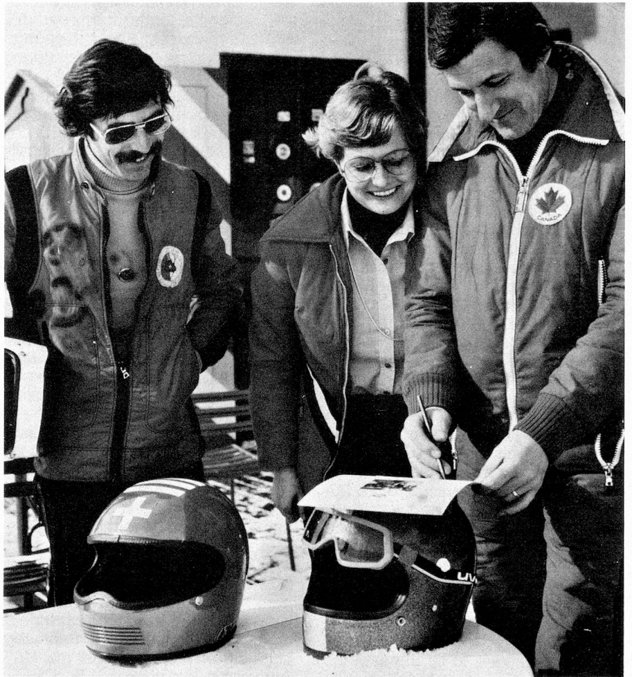
Presentation of the diploma at the Dracula Ghost Riders Club, the club house of the bobsledders of St. Moritz.

Incidentally, those whose enthusiasm is not quenched by that first ride may enroll in the St. Moritz Bobsledding School for a one-week beginners' course.