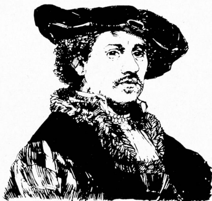
REMBRANDT HARMENSZOOM VAN RIJN, 1606-1669. Dutch painter and etcher.

Araldite® epoxy resins made by Ciba-Geigy's Plastics Division and familiar to the general public as adhesives, are an essential ingredient in the production of electrical and electronic components.