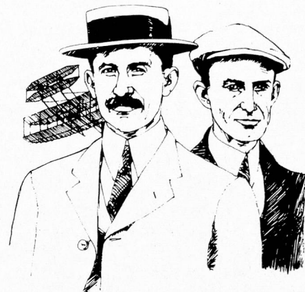
ORVILLE AND WILBUR WRIGHT, 1871-1948 and 1867-1912. American aeronautical inventors.

Pigments Division manufactures a wide range of lightfast, durable pigments, used in the production of high quality artists' colours. The division is also a leading supplier of organic pigments and dyes to the other colour-using industries.