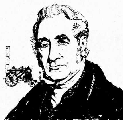
GEORGE STEPHENSON, 1781-1848. English inventor and engineer.

Foundry Chemicals Division, a subsidiary of Plastics Division, is a leading supplier of specialised chemicals for the foundry industry. The products include resins, silicates, hardeners, acid catalysts, conventional oil sand binders, facing materials and foundry paints.