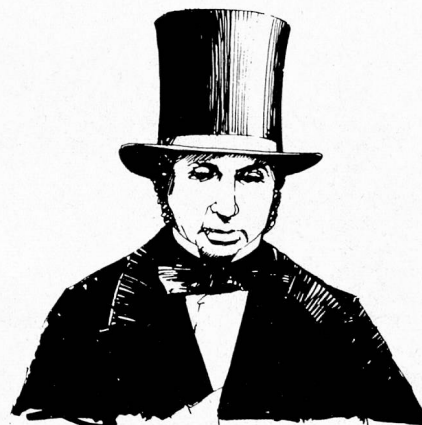
ISAMBARD KINGDOM BRUNEL, 1806-1859. English civil engineer.

Ciba-Geigy's Plastics Division is Britain's largest manufacturer of synthetic resin adhesives. Aerolite® urea resins, long established as outstanding wood glues, find their biggest use in the manufacture of chipboard and plywood, for veneering and all types of joinery.