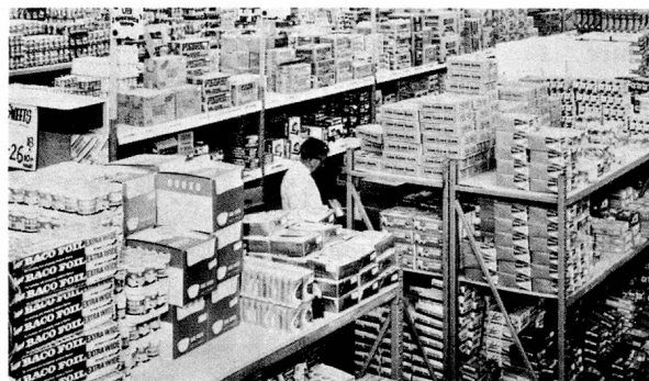
Series 70 MEDIUM DUTY 8,000 lbs. PER FRAME Racking for non-palletised merchandise. Clear spans up to 8 ft.

Acrowracks can be installed or adjusted to suit changing requirements quickly and at low cost. Find out more about them, telephone your nearest Acrow Branch Office today.