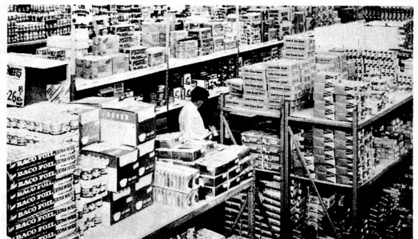
Series 70 MEDIUM DUTY 8,000 lbs. PER FRAME Racking for non-palletised merchandise. Clear spans up to 8 ft.

Acrowracks can be installed or adjusted to suit changing requirements quickly and at low cost. Find out more about them, telephone your nearest Acrow Branch Office today.