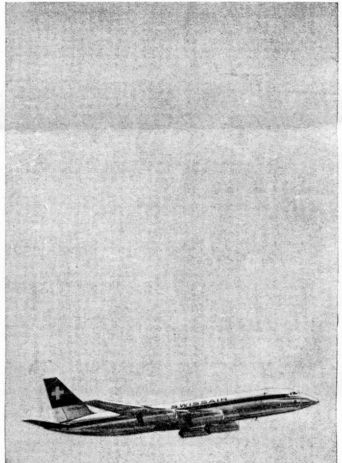
*IN ASSOCIATION WITH B.E.A.

THROUGHOUT THE WORLD ARE SERVED BY BIG, FAST SWISSAIR JETS INCLUDING THE CORONADO—THE WORLD'S MOST ADVANCED PASSENGER JET. DAILY CARAVELLE FLIGHTS FROM *LONDON TO ZURICH AND GENEVA CONNECT WITH SWISSAIR'S WORLD-WIDE JET NETWORK. SWISSAIR SERVICE IS LEGENDARY—PROVE IT FOR YOURSELF NEXT TIME YOU GO ABROAD.