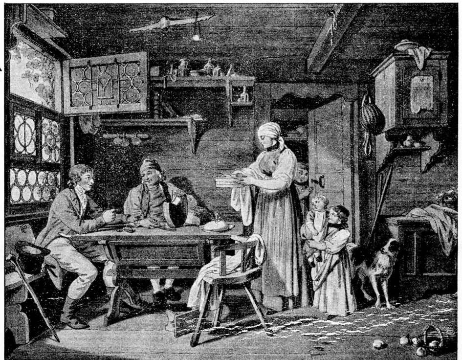
Sigmund Freudberger, Bern, 1745—1801