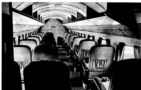
Die geräumige, schalldichte Kabine des neuen Grossflugzeuges mit 21 Sitzen.

L'essentiel n'est du reste pas là; il est dans le fait que parti radical a surmonté victorieusement une crise intérieure qui, selon les événements, pouvait devenir très grave et produire les effets les plus fâcheux. Nous l'avons dit plus d'une fois et nous le répétons: tout citoyen ami de l'ordre, même s'il n'est pas radical, doit souhaiter que ce parti reste uni et que son action puisse se faire sentir dans notre vie nationale. L'unité obtenue à Olten par le comité central, la