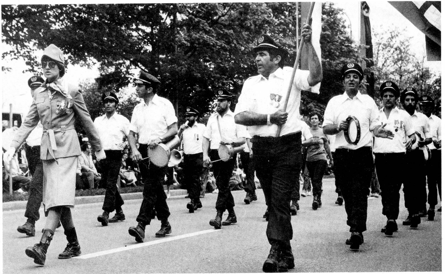
Music sets the pace for the two day event