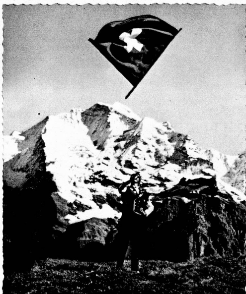
Greetings from Switzerland