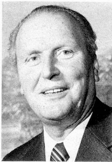
Willi Ritschard , Vice-President Federal Department of Transport, Communications and Energy