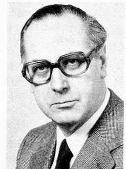
Hans Hürlimann Federal Department of the Interior