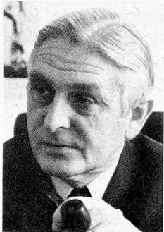
Ernst Brugger Federal Department of Public Economy