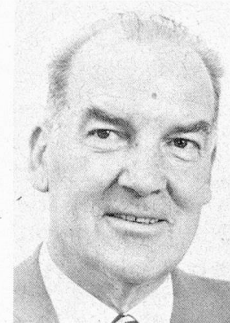
Rudolf Gnägi Federal Military Department