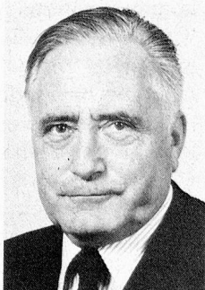
Georges-André Chevallaz Federal Department of Finance and Customs