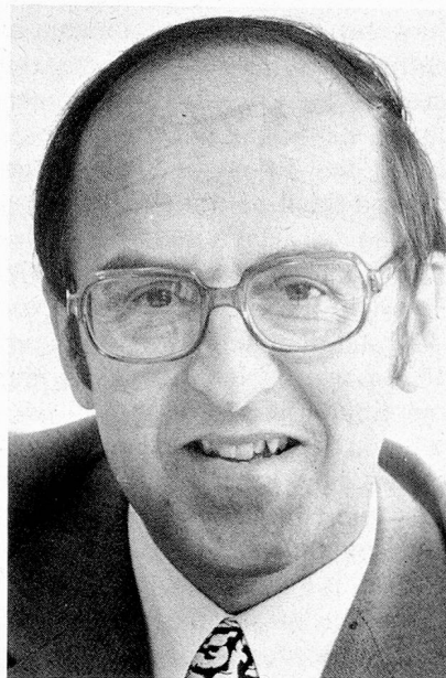
Kurt Furgler President of the Confederation Federal Department of Justice and Police