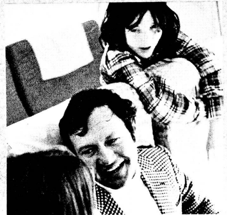
Leg and elbow room.