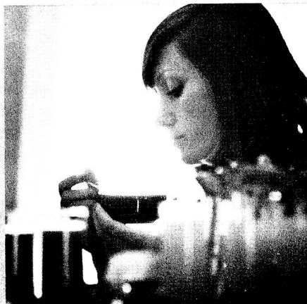
Good morning, Rio.

Swissair flies a modern, spacious, and comfortable DC-10 once a week, a DC-8 twice a week to Rio, Sao Paulo, Buenos Aires, and Santiago. It costs no more. The connections from London are good — and you can travel in style. Isn't that wonderful?