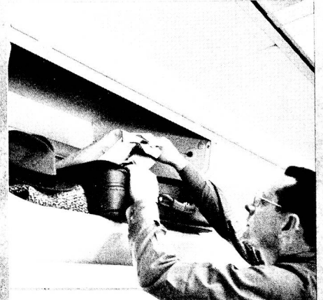
Luggage in the compartments is always ready to hand. But never in the way.