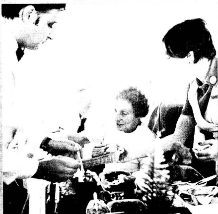
Service leaving nothing to be desired.