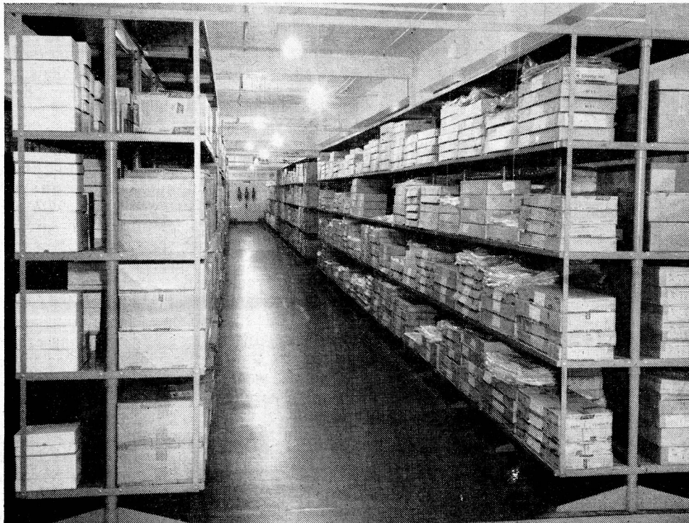
The illustration shows Acrow Cantilever Shelving installed in the Guildford branch stockroom of Marks & Spencer Ltd.

J. B. REYNIER LIMITED 16-18 TACHBROOK STREET LONDON, S.W.1 VICtoria 2917/18