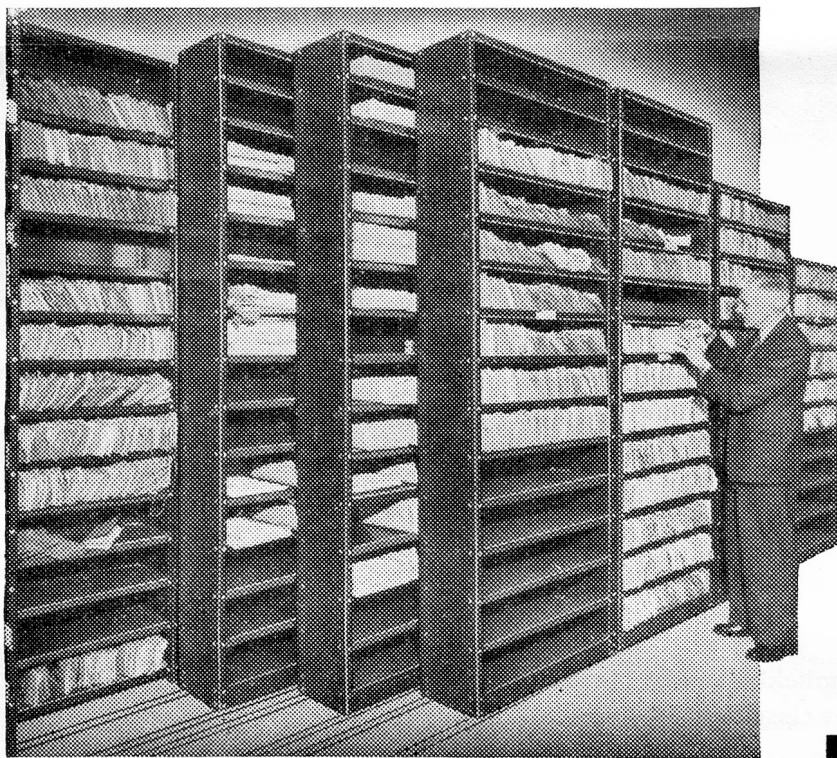
Illustration shows part of Rolstore installation at Northern Assurance Co's Record Office, at Moorgate, London

LOCARNO — Nella sala del Consiglio Comunale a Palazzo Marcacci, si è svolta nella mattinata di sabato, 2 aprile, alla presenza delle massime autorità dei due Paesi un Convegno italo-svizzero in margine all'Esposizione dei progetti d'idrovie interessanti la Svizzera. Il palazzo municipale era stato per l'occasione riccamente imbandierato e numerose piante verdi