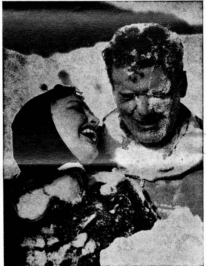
The sparkling fun of snow and sun

occupato della decurtazione dei fondi messi a disposizione della RSI. Il Presidente del Consiglio di Stato ha dichiarato che il Governo ticinese è a conoscenza della questione. Sa che la CORSI è già insorta contro il riparto deciso dal Comitato centrale della Radio Svizzera e ha già inoltrato un ricorso presso l'Autorità di vigilanza, che è il Dip° federale delle Poste e Ferrovie. La questione, ha detto l'on. Celio, ha in verità assunto aspetti che esulano dalle semplici divergenze amministrative, per rivestire