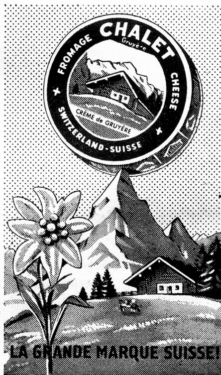
Famous all the World over for Quality and Tradition

To Basle, it will leave on Fridays, April 13th and 20th, at 23.05 and on Saturday, April 28th, at 00.05.