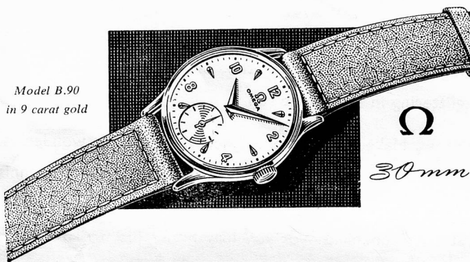
Model B.90 in 9 carat gold

OLYMPIC GAMES — For 20 years Omega has timed the Olympic Games. Again the most exacting and impartial experts have chosen Omega to time the 1956 Olympics in Melbourne, Australia. This is the highest recognition any watch has ever received from the countries of the world.