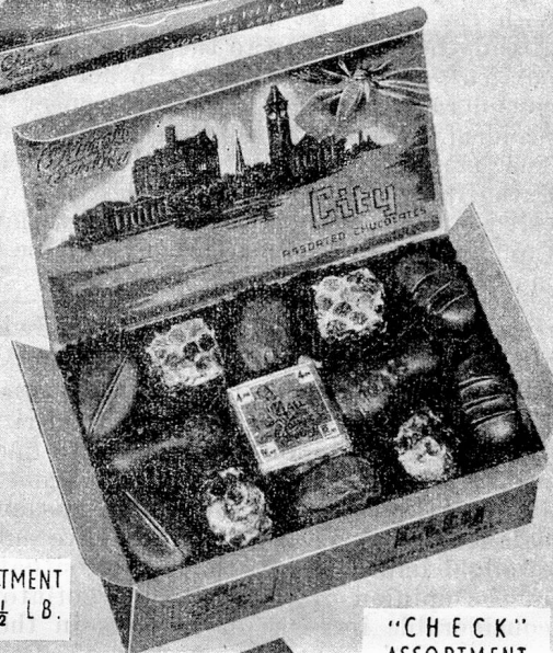
"CHECK" ASSORTMENT 2/10 PER ½ LB.