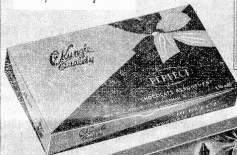
"PERFECT" ASSORTMENT 2/10 PER ½ LB.