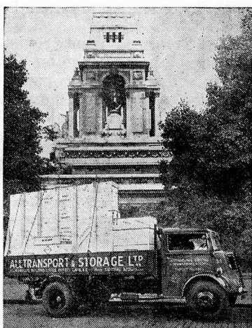
Traffic to and from all parts of the World

Official Passenger Agents for all Principal Steamship Companies - Official Freight & Passenger Agents for all Air Lines