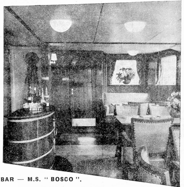
BAR — M.S. "BOSCO".

Der Kapitän setzt eine grüne Flagge bei (Zollflagge für Transitgüter) und vorwärts geht's, in den Abend hinein, Holland mit seinen Windmühlen hinter uns lassend.