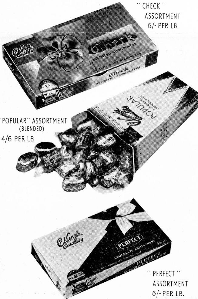
"CHECK" ASSORTMENT 6/- PER LB.