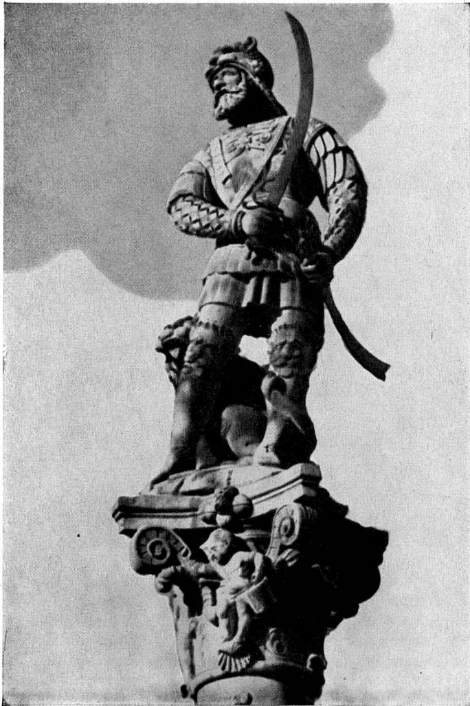
Fontaine de la Vaillance

jischen «Fondue» ennet der Saane nichts gemein hat als den Namen. —