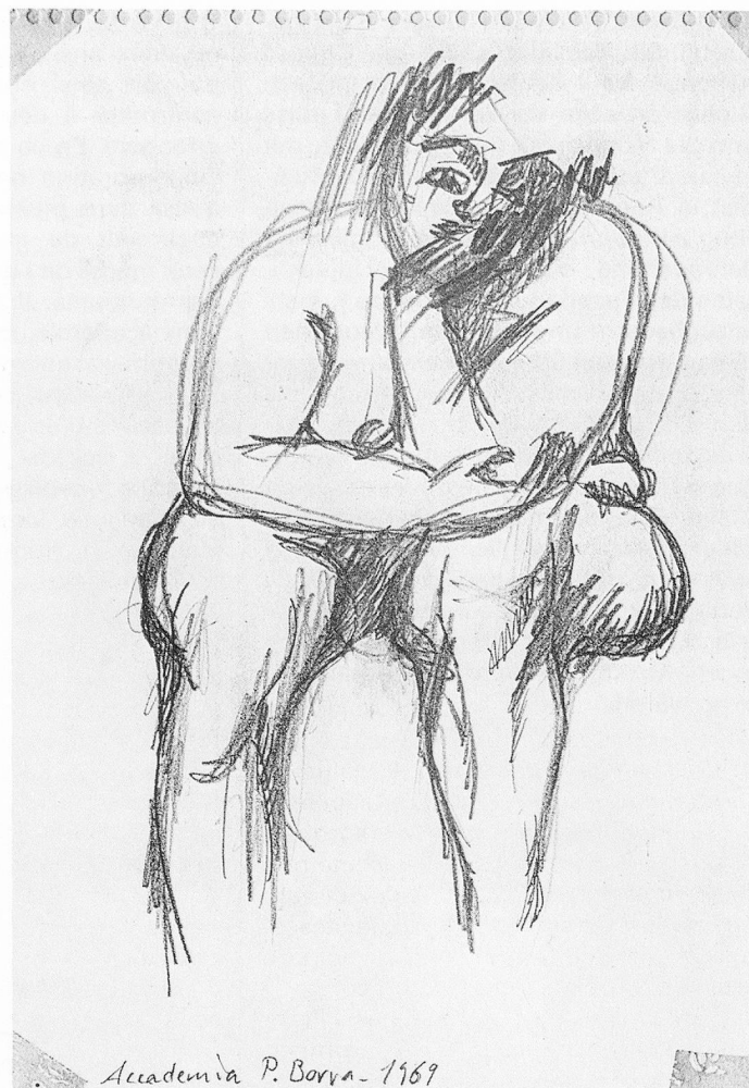
Disegno, 1969, matita, 30×22 cm