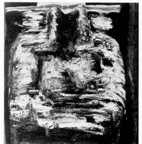
Grembo, 1988, olio su tela, 170 x 160 cm