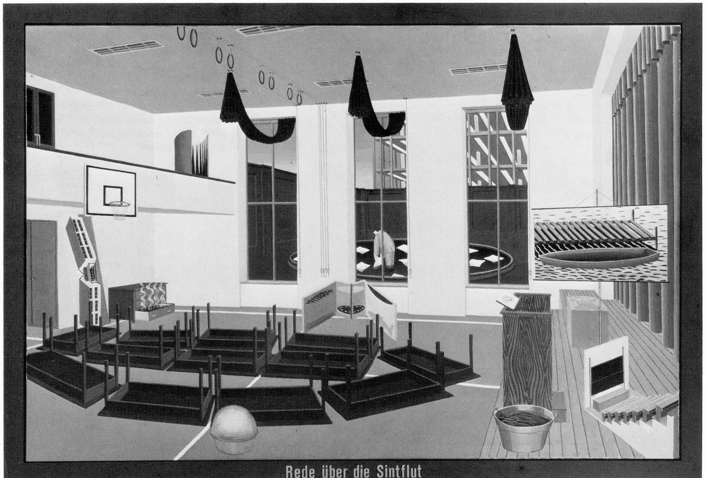
Rede über die Sintflut