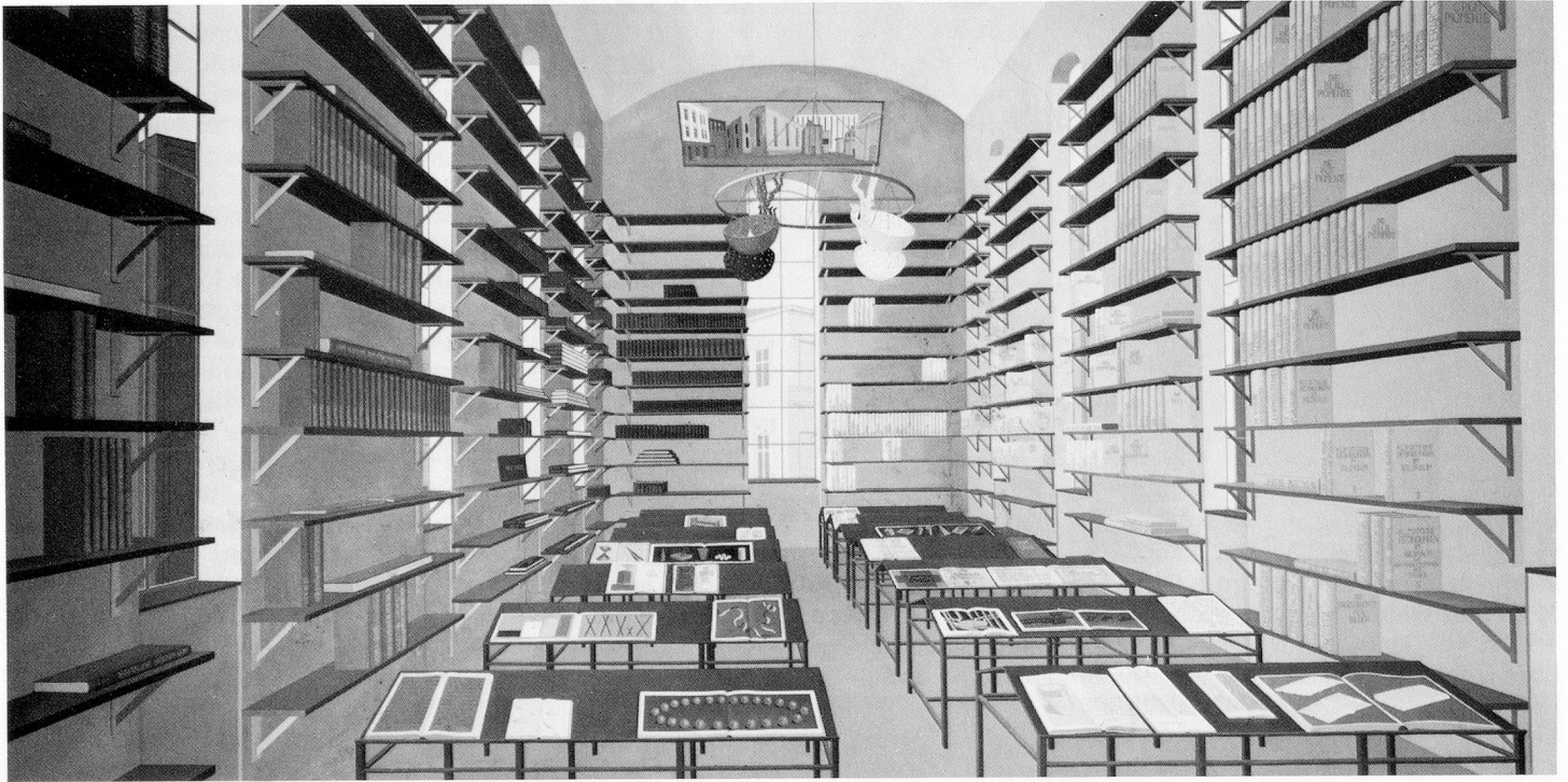
Die Bibliothek, 1988, Öl auf Leinwand, 250 x 250 cm