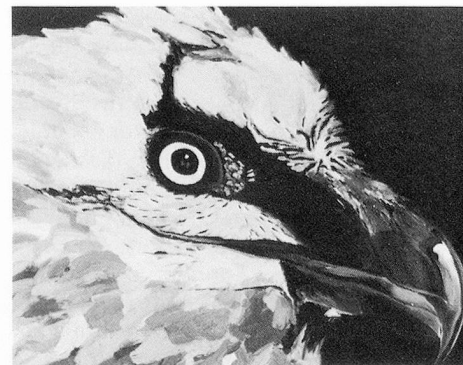
Vogelkopf (zu Beginn des Studiums) Öl auf Leinwand, 50×80 cm