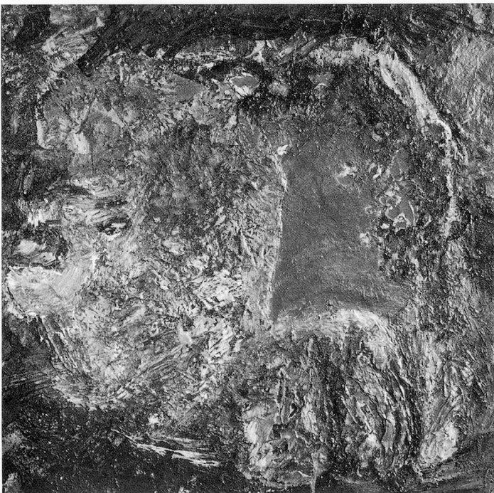
Schrund, 1988, Öl auf Leinwand, 100×100 cm