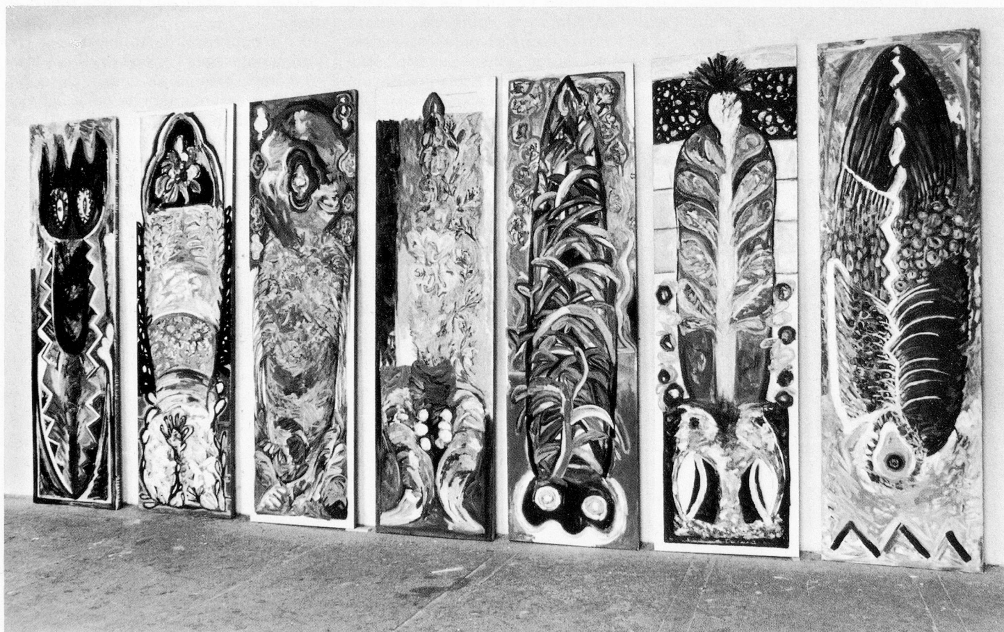
Sonntagsbräune (während des Studiums), Öl auf Leinwand, je 85×285 cm