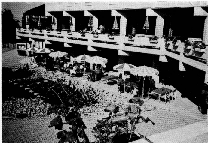
L'apéritif sur l'alpe