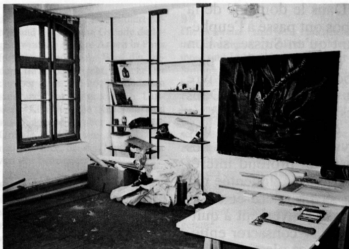
Atelier, Binz 39, Zurich

L'expérience de «BINZ 39» date de quatre ans. Comme je vous l'ai dit toute à l'heure, j'assume pour l'instant seul la totalité de l'animation et de la gestion des ateliers. Cela signifie donc que je choisis également seul les artistes à qui j'offre les possibilités de travail dans le cadre de «BINZ 39». Cela me paraît normal. Je me fie à mes goûts, à mes affinités à partir de ce que je peux connaître d'intéressant au sein de la