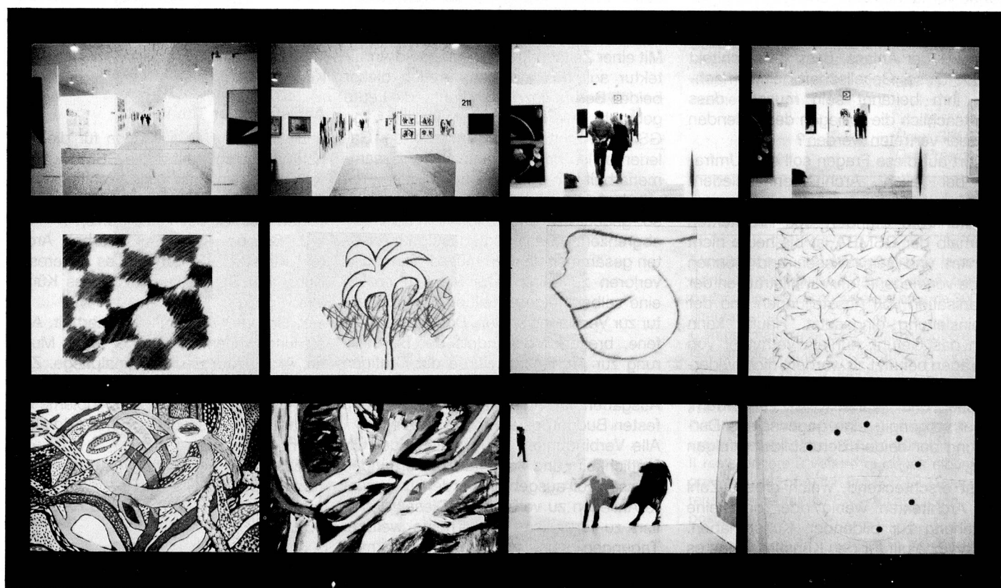
Weihnachtsausstellung, Züscha, Zürich 83/84.