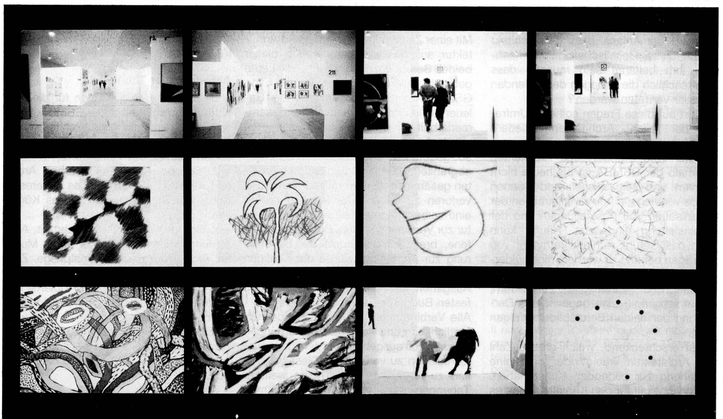
Weihnachtsausstellung, Züspa, Zürich 83/84.