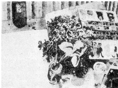
Palette genevoise, aquarelle de Samuel Buri, au Musée de Zoug.

Parallel zu der thematischen Ausstellung «Desing – Formgebung für jedermann» ist es möglich, eine Sammlung von Designobjekten amerikanischer Herkunft zu zeigen. Sie führen von den dreissiger bis in die fünfziger Jahre und verkörpern das Styling dieser Epoche. Es sind Radios, Bügeleisen, Toaster, Uhren, Thermosflaschen, Syphonflaschen und andere Gegenstände aus dem häuslichen Gebrauch. Die Stromlinie, das Bakelit, glänzender Chromstahl treten in Erscheinung, es ist eine bunte und reiche Formensprache, die Nostalgiegefühle weckt, aber auch aktuell ist durch ihre Bezüge zu dem heute in amerikanischen Designer- und Architektenkreisen um sich greifenden «New Ornamentalism». Nicht übersehen darf man den soliden Gebrauchswert dieser Objekte und ihre genau kalkulierte Marktfähigkeit in einer zu ihrer Entstehungszeit als modisch neu geltenden Marchart. Rund 150 dieser Beispiele einer der populären Geschmackskulturen im 20. Jahrhundert vereint die Ausstellung. Heute sind es begehrte Sammelobjekte. Sie laden zum Formenstudium ein und sind ein Schauvergnügen. Eine Bucher- und Zeitschriftendokumentation mit Designliteratur aus der Zeit ergänzt die Ausstellung.