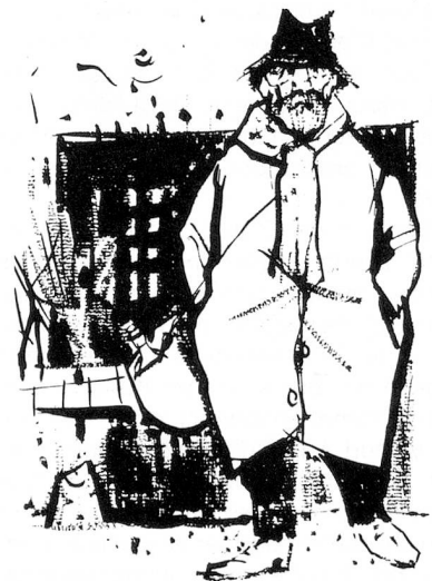
Illustration de l'ouvrage «Du haut de ma potence», Edition du Jura Libre, 1961.